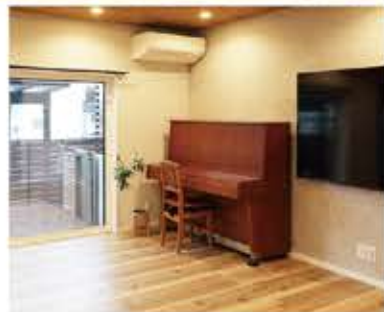
写真上 / 2階洋室の床を撤去し大きな吹き抜けに。元々あった柱を見せ柱として残して化粧梁と火打ち梁で補強。のびのびと広がる大空間になりました。写真下 / 奥様が子供の頃に弾いておられたピアノは以前ずっと応接間にありました。今回広いリビング空間の主演を演じてくれています。